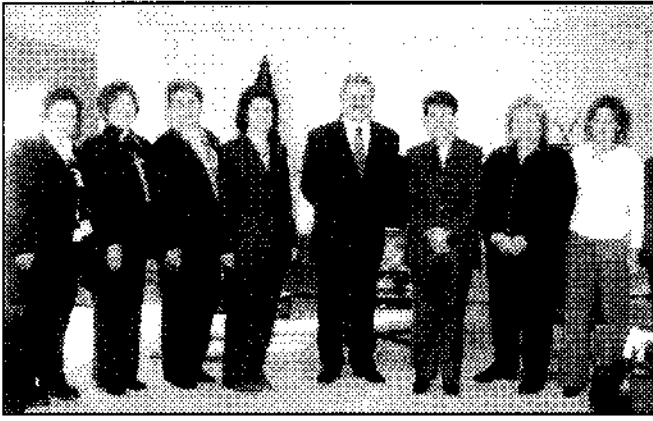
Kayseri Valisi Nihat Canpolat ziyaret edildi.