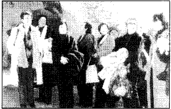
Soğanlı Ören yeri.

5 Aralık Cumartesi günü büyük bir heyecan vardı. Otellerden alınan gruplar Stadyumun önünde toplanmaya başlarken Şube başkanları Genel başkanlığında Kayseri Valisi Nihat Canpolat'ı ziyaret ettiler. Kadınlardan oluşan grup çevreden büyük ilgi ve alkışlarla karşılanıyordu. Elleri bayraklar ve geldikleri şehrin adını taşıyan kadınlar büyük bir grup halinde Cumhuriyet Alanına doğru ilerliyordu. Atatürk Anıtı'na Genel Başkan ve Kayseri Şube Başkanının çelenk koymasından sonra saygı duruşunda bulunuldu ve coşkuyla İstiklal Marşı okundu. Kayseri Şube Başkanı Ayşe Uzunlu'nun konuşmasından sonra Genel Başkan Av.Sema Kendirci günün anlam ve önemini belirten bir konuşma yaptı.